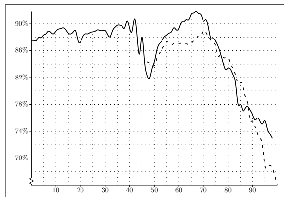
Grafiek 2.10: burgerlijke huwelijkssluitingen waarin beide partijen voor de eerste maal trouwen, Nederland van 1900 t/m 1998 (doorgetrokken) en België van 1947 t/m 2000 (gestreept).

Maakt de eerste huwelijkssluiting moeilijke tijden door, de tweede bloeit als nooit tevoren. Grafiek 2.10 toont dit: meer dan ooit komt trouwen eind jaren negentig op hertrouwen neer.